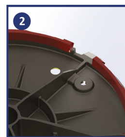
Двухточечный пружинный замок